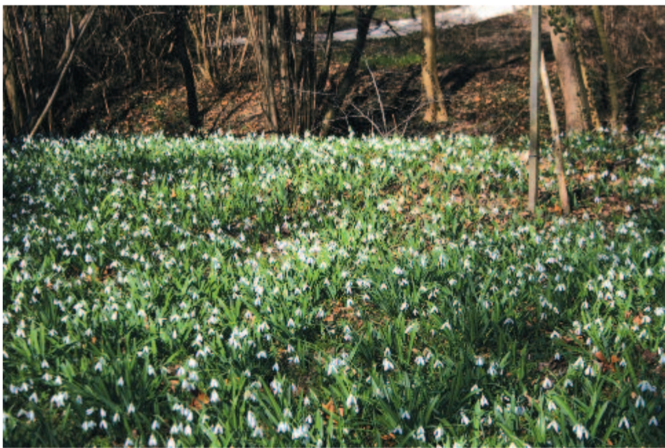
Ifjú erdő testén átnyilalló hóvirág allé

Maradok kiváló tisztelettel. Kelt 2018-ban, március idusán