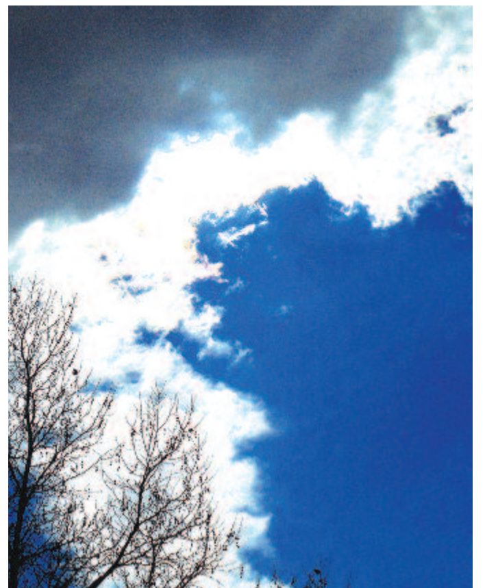
Nap-éj egyenlőséget álmodik a lombját hagyó ágveg

Tavasszal, 250 éve, 1767. március 20-án született Monostorapátiban Varga Márton természettudós, akadémiai tanár. Szombathelyen, Székesfehérváron, Győrben tanult. Komáromban, Nagyváradon, Győrben tanított. 1796-ban a három éve alapított Erdélyi Magyar Nyelvművelő Társaság Vásárhelyi tagjai közé választotta. Tanárként sokat tett a természettudományok magyar nyelvű megismertetéséért, s mint nyelvművelő is a tudomány szaknyelvének kialakításán fáradozott. Fő művei – az 1808-ban Nagyváradon nyomdafestéket látott A gyönyörű természet tudomá-